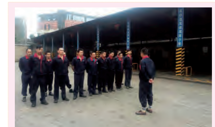
二车间认真贯彻执行公司要求，每周一至周五，维修班组织员工站队集合召开展会。对当班人员进行点名签到，布置当天保养车辆的任务，强调注意事项，并针对前一天的保养进行认真总结和分析，以提升车辆维修保养质量。 (周京亚)